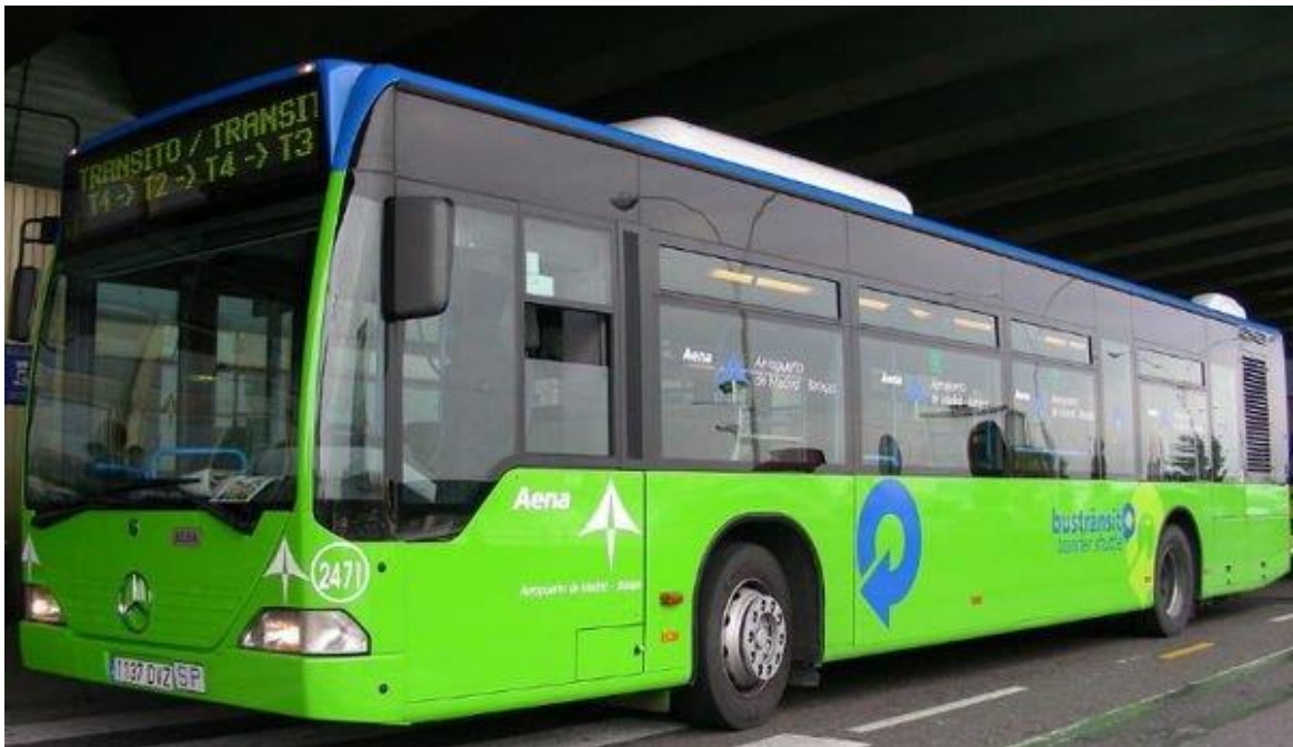
Autobús gratuito que conecta todas las terminales del aeropuerto de Madrid (T1, T2, T3, T4)

Por lo general, los vuelos provenientes de Latinoamérica aterrizan en la Terminal 4S (Satélite), una vez pasado los controles migratorios, deberán tomar un tren subterráneo totalmente gratuito que te conectará con la T4. Una vez allí podrán recoger el equipaje y salir para tomar el autobús gratuito con dirección Terminal 2 (T2) para tomar el autobús N° 824 con dirección Alcalá de Henares.